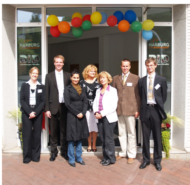
Das Citymanagement- und BID-Team vor dem neuen Ladenbüro

Seit September agieren das Citymanagement Harburg und das BID Lüneburger Straße von ihrem gemeinsamen Ladenbüro in der Harburger Rathausstraße 45 aus. Vom dem neuen, gemeinsamen Innenstadtstandort aus soll mit kreativen Ideen und Engagement die Attraktivität der Innenstadt gesteigert und das Image Harburgs verbessert werden.