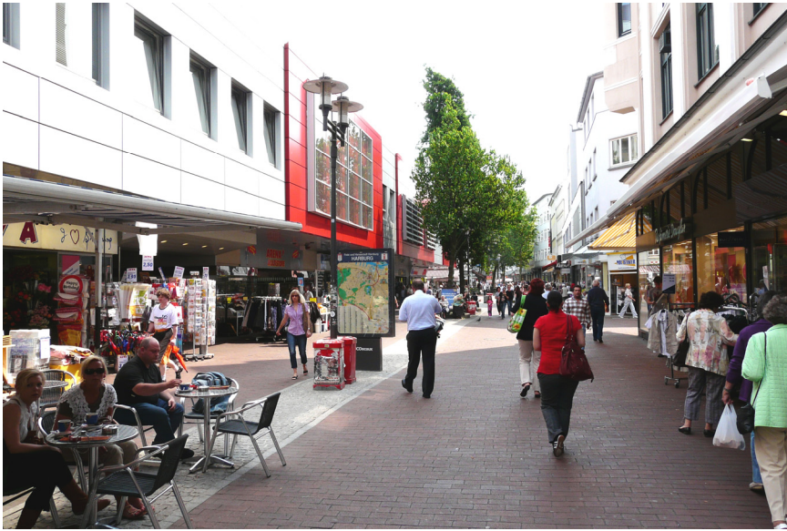
Fußgängerzone Lüneburger Straße